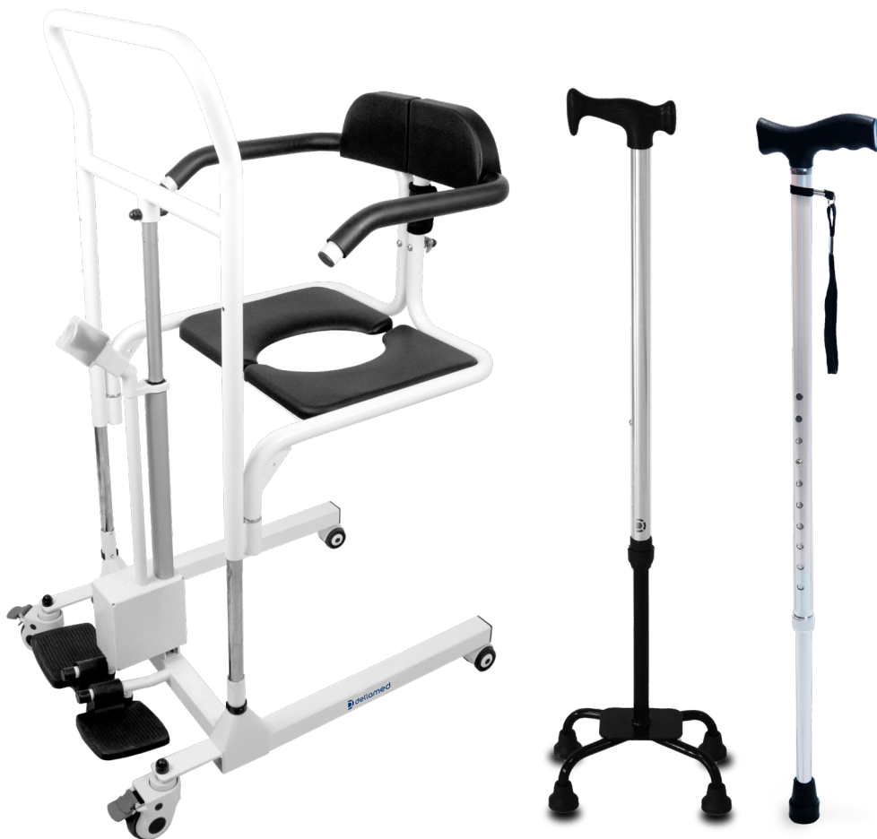
Cadeira de Transferência D80 - Bengala D8 - Bengala D9 4 Pontas